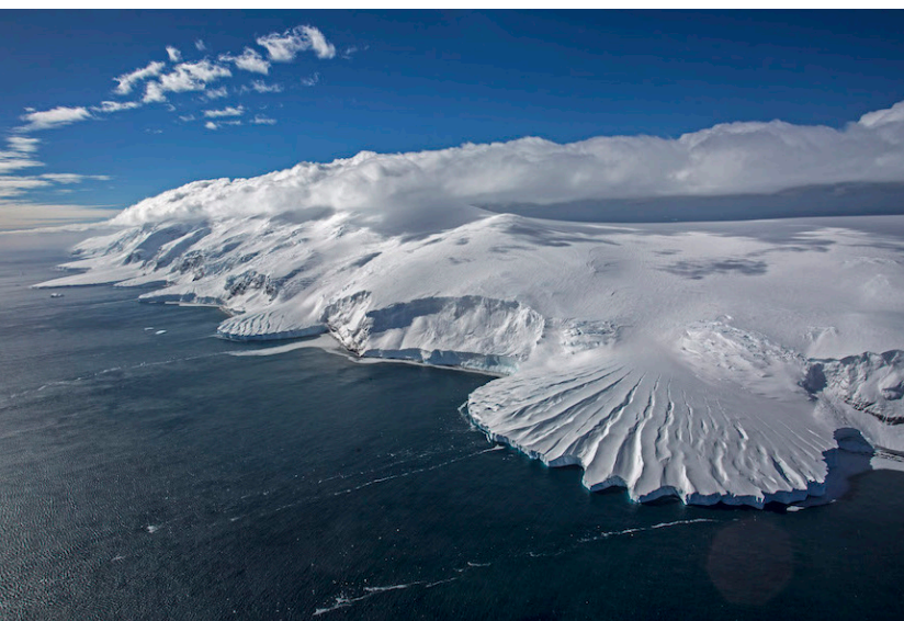
Un glacier d'Antarctique

La région environnant le pôle Sud, l'Antarctique, est une terre recouverte d'un énorme glacier vieux de millions d'années. Ce glacier est tellement lourd qu'il glisse, bouge et se casse. Comme il est entouré par un océan, lorsque des morceaux se détachent, ils tombent dans l'eau. Ces morceaux de glace qui flottent s'appellent des icebergs.