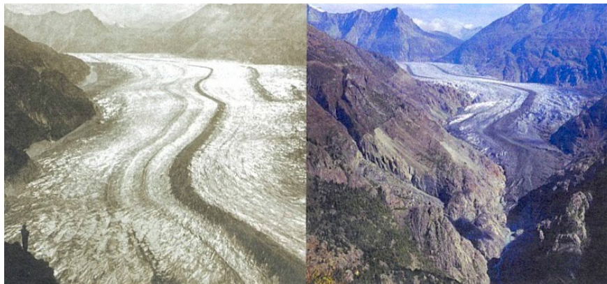
1) Glacier d'Aletsch 1856

Comme les glaciers de montagne sont souvent loin des mers et des océans, on pourrait penser que leur fonte ne fait pas augmenter le niveau des eaux. Et pourtant, ils y contribuent. L'eau qui sort des glaciers crée des rivières et des lacs, et coule jusqu'aux mers et océans. Les glaciers de montagne fondent de plus en plus vite, car la neige qui tombe en hiver ne suffit plus pour remplacer la glace qui fond lors des étés de plus en plus longs et chauds. À tel point que certains glaciers alpins ont déjà presque intégralement disparu.